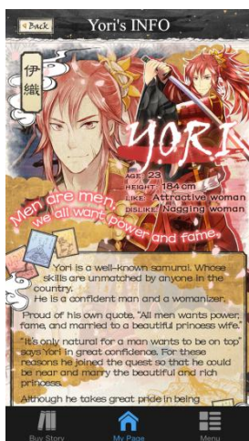
自信家で女好きな剣豪 Yori