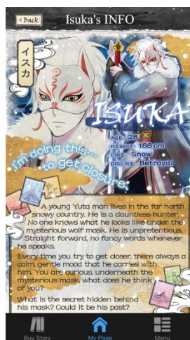
神秘のベールに包まれた Isuka