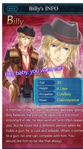
透視能力を持つセクシーなビリー