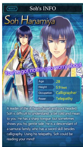
テレパシー能力を持つクールな蒼