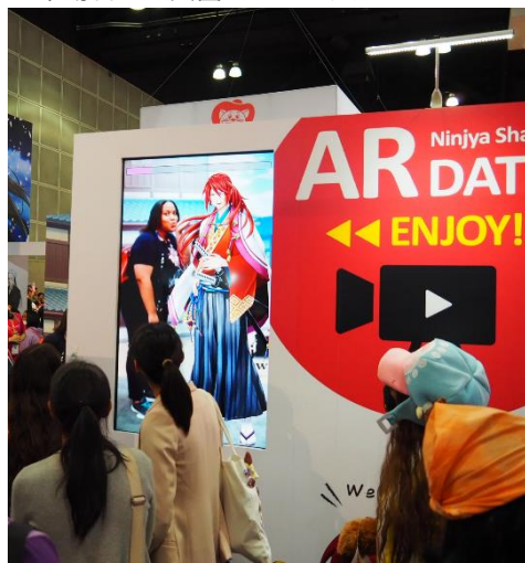
▼来場者も大興奮の AR エリア