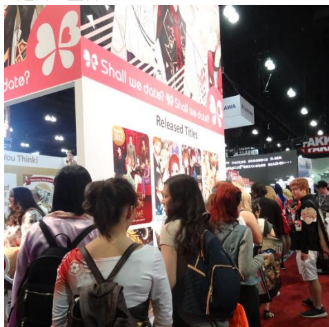
▼連日大盛況のブース