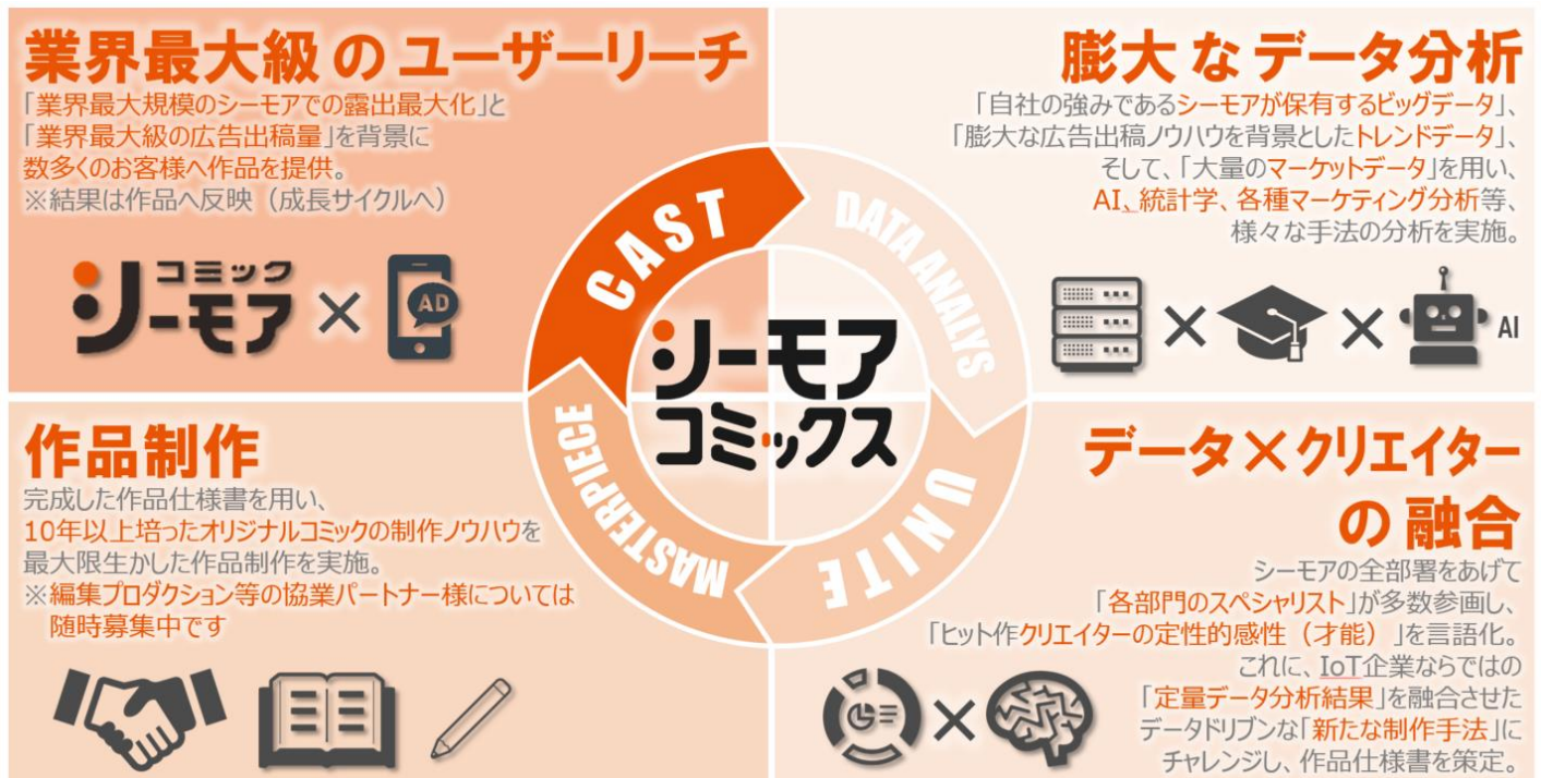
（図1）『シーモアコミックス』ビジネスモデル イメージ

個性豊かなオリジナル作品を幅広いジャンルで創出し続ける『ソルマーレ編集部』と異なり、『シーモアコミックス』は、データを活用した新たな制作手法にチャレンジします。