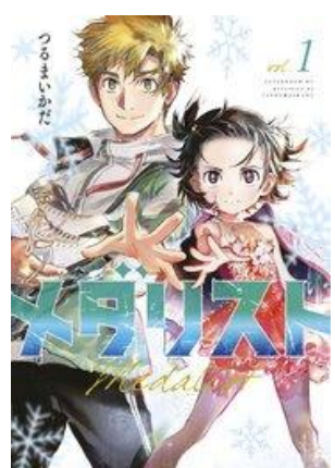
講談社 メダリスト つるまいかだ

夢破れた青年・司と、見放された少女・いのり。でも二人には、誰より強いリンクへの執念があった。氷の上で出会った二人がタッグを組んで、フィギュアスケートで世界を目指す！