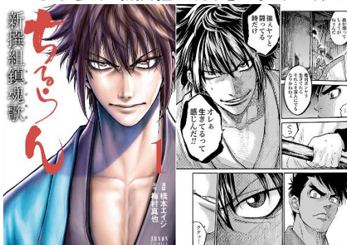
「ちるらん 新撰組鎮魂歌」 ©橋本エイジ・梅村真也/コアミックス

「新撰組が好きだからです！」 「もともと新撰組に関心があり、関連する多数の文 献・小説・漫画を読み、映像化作品も観てきた。今 回また新たな解釈で映像化されたとのことで、その 原作の漫画を読みたいと思ったから」 「史実や時代考証が違うようですが、新撰組が好き なので、別の角度から読んでみたい」