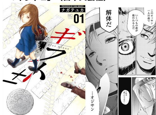
「ギフト±」©ナガテユカ/日本文芸社

「命と臓器移植と犯罪について考えさせられる重いテーマ！でも、次が気になってしまいます。ゆっくり落ち着いて読んでみたいです」