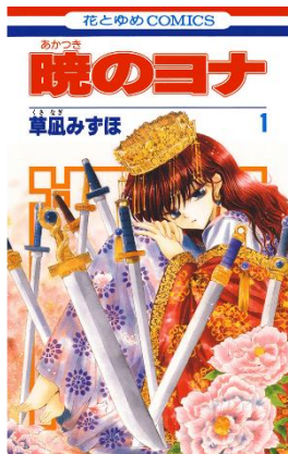
「暁のヨナ」©草風みずほ/白泉社