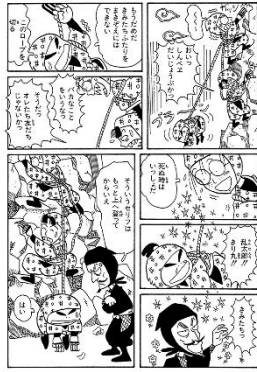
「落第忍者乱太郎」 ©尼子騒兵衛/朝日新聞出版