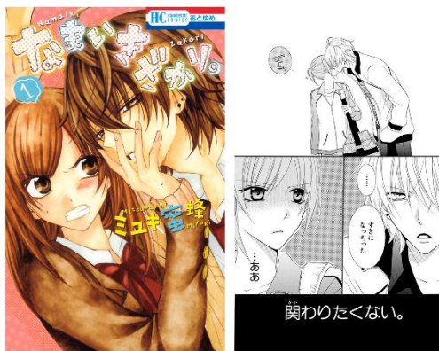
「なまいきざかり。」 ©ミユキ蜜蜂/白泉社

「ミユキ蜜蜂先生がとにかく好き、そして一番好 きな作品。定期的に読み返したくなる」 「成瀬がかっこいい！」 「キュンキュンするシーンが目白押しで、定期的に読み 返したくなる作品です」