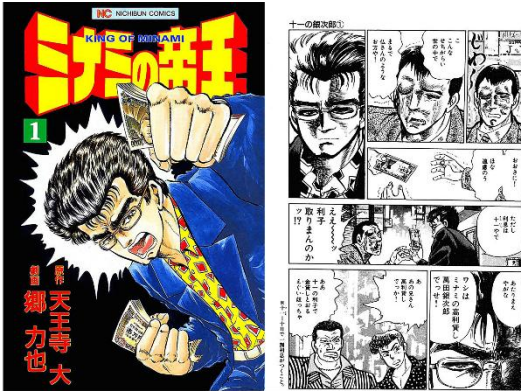
『ミナミの帝王』 ©天王寺大・郷力也/日本文芸社