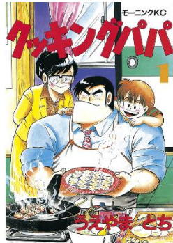
『クッキングパパ』 ©うえやまとち/講談社

「クッキングパパは長編で連休中に読みながら 実際に出てきたレシピで料理してみたい」 「連休になったらゆっくり読んで、作り置きおか ずに挑戦してみたいです」 「料理のレパートリーを増やしたいから」