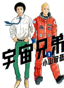
『宇宙兄弟』©小山宙哉/講談社