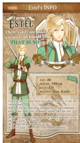
優雅で気品あふれる Estel