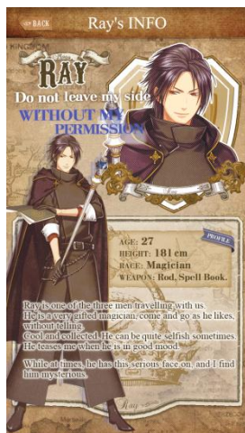
自分勝手だけど憎めない Ray