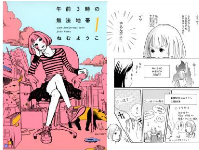
「午前3時の無法地帯」©なむようこ/祥伝社 FEEL COMICS

「ピリピリした職場でも癒しになってくれそう」 「明るくて前向き。引っ張って行ってくれそう」 「グチを言い合ったり美味しいものを食べたりお互いを励ましなが仕事と一緒に頑張りたい！」