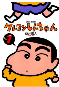
「クレヨンしんちゃん」© 臼井儀人/双葉社