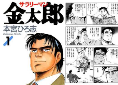
「サラリーマン金太郎」©本宮ひろ志

「情熱があり、熱心で男らしい。自分自身も成長できて、仕事も楽しくできそう」 「最近は金太郎のような求心力のあるサラリーマンが減ったような気がする。職場に1人は金太郎のような人が欲しい」 「頼れる上司!!というイメージ、自分も仕事を頑張れる」