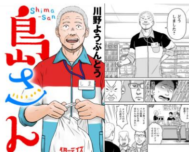
「島さん」©川野ようぶんどろ/双葉社

「出世をしても親しみやすい存在でいてくれそう」 「優しいし、人情があり仕事でミスしてもさりげなくフォローしてくれそう」 「島さんの大きな懐に実際に触れて、自分も人間的に大きく優しくなりたい」