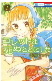
「コレットは死ぬことにした」© 幸村アルト/白泉社