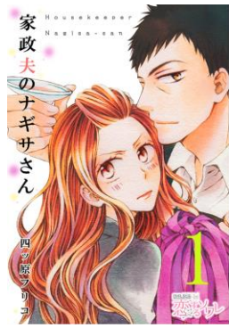
「家政夫のナギサさん」© 四ツ原フリコ/ソルマーレ編集部