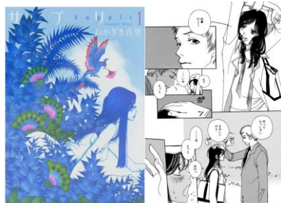
「サブリ」©おかざき真里/祥伝社 FEEL COMICS

「ミナミさんの切れ味のいい仕事っぷりに憧れる」 「一緒に働く上で心強いから」 「働く女性としてカッコいい。ミナミさんから刺激をもらったから」